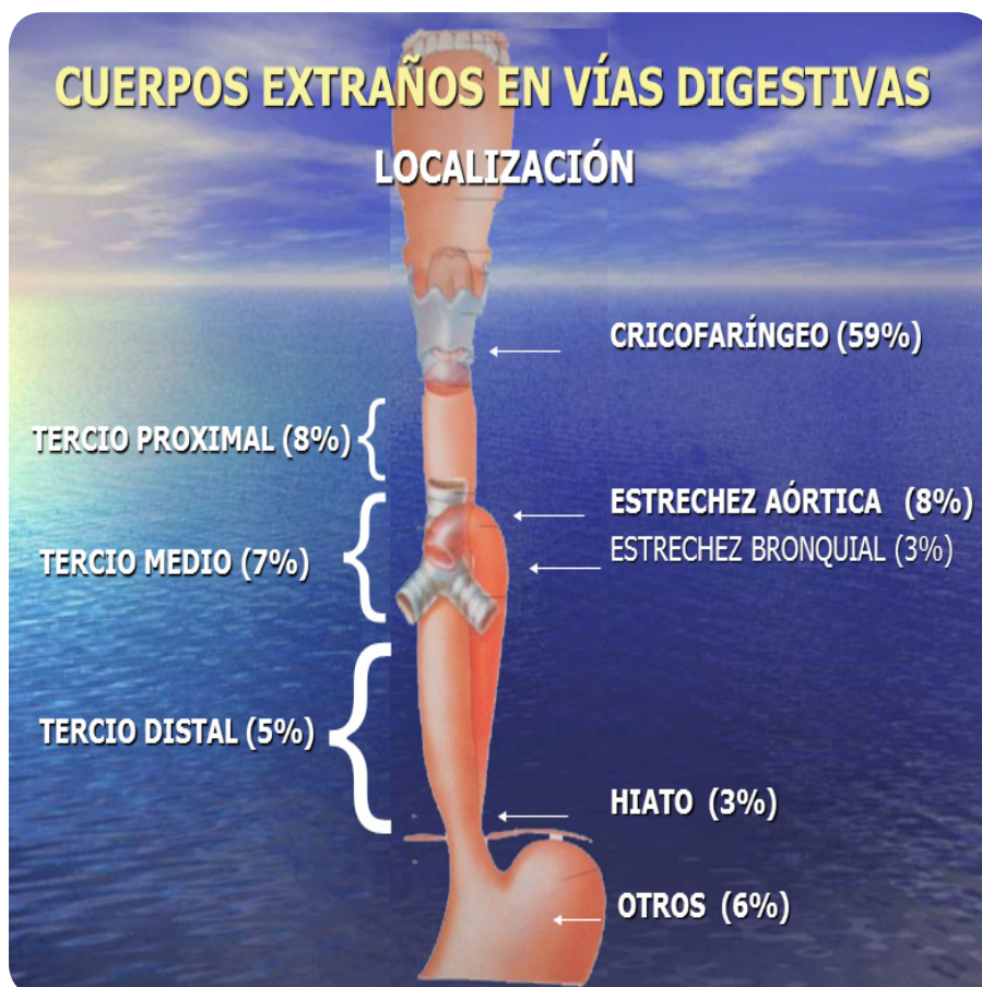
Fig. 1. Estrecheces naturales en el tubo digestivo.

Los primeros datos los recogemos de los padres que nos refieren de la ingestión del cuerpo extraño por el niño. En un principio, durante segundos puede tener una crisis de