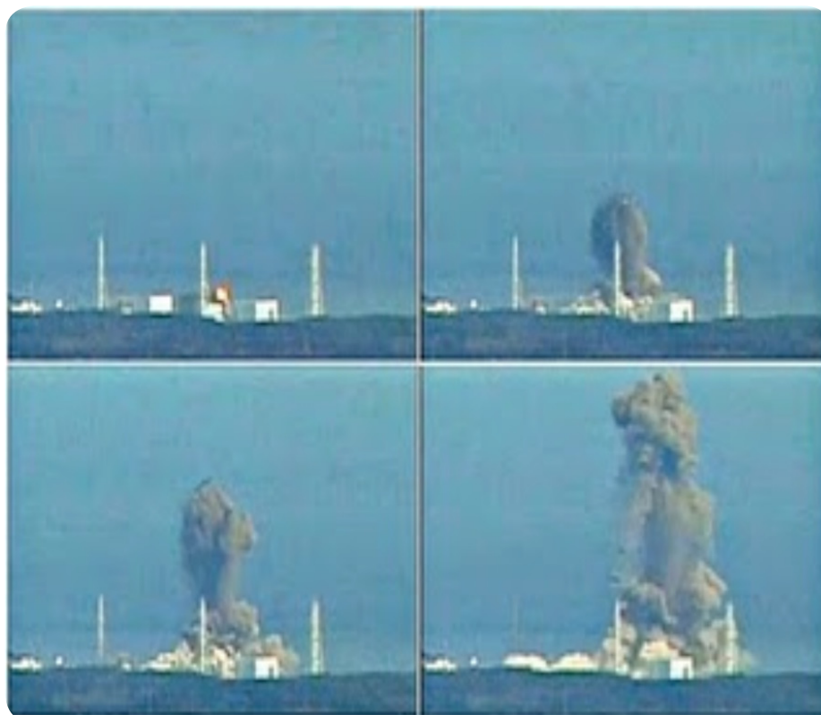
FIGURA 2. Vista panorámica de las seis unidades de Fukushima con los penachos.

La coloración en la zona de origen de los penachos, es similar a la que presentan las masas sometidas a altas temperaturas, como lava reciente, o la colada de un horno metalúrgico. Si se tratara de la combustión del hidrógeno, se observaría una zona esférica en llamas.