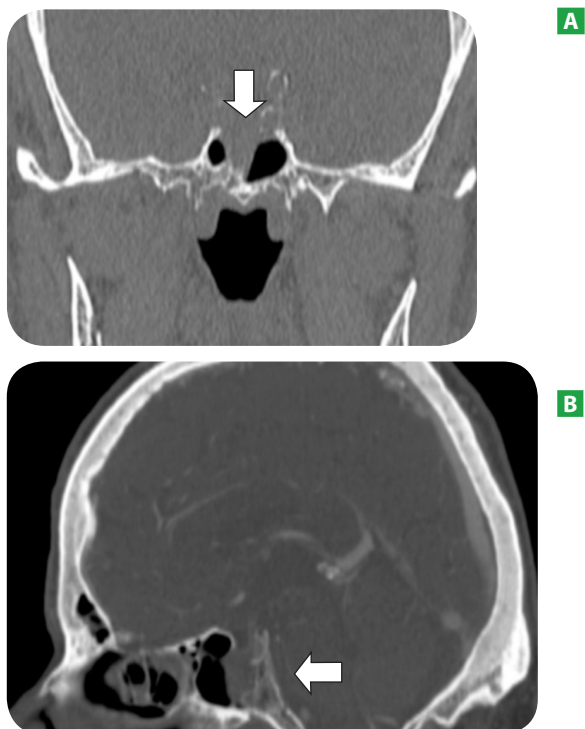
FIGURA 1. TC de senos paranasales, corte coronal sin contraste intravenoso (A), y corte sagital con contraste intravenoso (B) que muestran una masa de partes blandas en la luz del seno esfenoidal (flechas) que destruye el techo del mismo y el suelo de la silla turca con remodelación del clivus.

de una hermana fallecida por neoplasia de mama. Acude al hospital por presentar cefalea de predominio occipital y dolor facial difuso de dos meses de evolución, acúfenos continuos que los describe en el hemicraneo izquierdo, febrícula y malestar general. A la exploración física mostró a nivel de fosas nasales una desviación septal importante, leve edema de concha medio izquierdo, faringe y laringe normales. En los exámenes de laboratorio ordenados, hemograma y bioquímica, solamente se identificó una leve anemia sin interés patológico. En la TC craneal se visualizó una lesión expansiva con densidad de partes blandas en seno esfenoidal, con signos de erosión ósea de la pared póstero superior de dicho seno, de aproximadamente 1,5 cm de diámetro máximo, observando remodelación ósea a nivel de clivus y destrucción del suelo de la silla turca y tabique interesfenoidal, contactando la lesión con la adenohipófisis ( figura 1 )